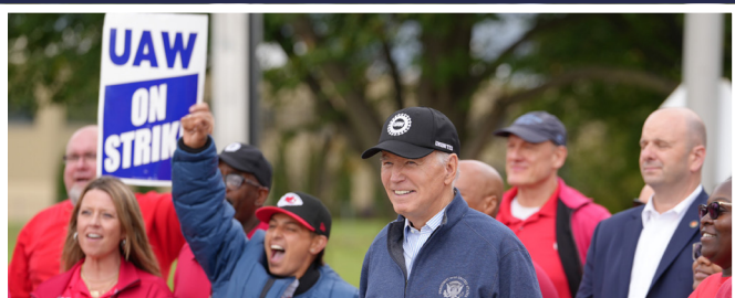
Le président Biden a rejoint le piquet de grève de l'UAW à Belleville, Michigan, le 26 septembre 2023.

pour participer aux piquets de grève à Détroit, dans le Michigan, afin de soutenir la grève des Travailleurs unis de l'automobile (UAW) contre les trois grands constructeurs automobiles. Notre syndicat a organisé une journée d'action pour soutenir l'UAW dans tous les États-Unis. Nos conseils de district ont renforcé les piquets de grève dans plusieurs États, dont la Californie, la Floride, l'Illinois, le Missouri, la Pennsylvanie, le Rhode Island, la Virginie, la Virginie-Occidentale et le Wisconsin. La semaine même où les dirigeants de l'IUPAT se trouvaient dans le Michigan pour