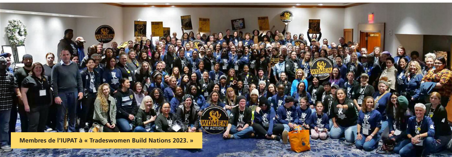
Membres de l'IUPAT à « Tradeswomen Build Nations 2023. »

Nous sommes tous dans le même bateau. C'est notre carte syndicale qui nous lie en tant que syndicat, en tant que famille, et en tant que force avec laquelle il faut compter, à la fois au sein de nos industries et en tant que représentants des travailleurs qui contribuent à faire fonctionner nos pays. Lorsque nous devenons membre de l'IUPAT, cette carte représente un lien qui transcende nos différences. Nous sommes l'IUPAT. En 2024, soyons unis pour construire un syndicat encore plus fort.