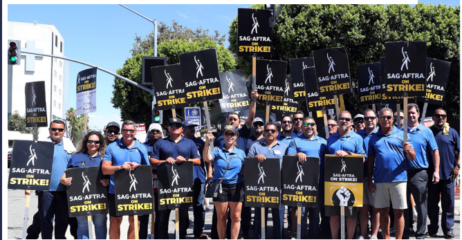
Les dirigeants de l'IUPAT participant au piquet de grève de la SAG-AFTRA à Los Angeles, en août 2023.

En septembre, j'ai rejoint les membres de notre conseil exécutif général et les membres du conseil de district 1M